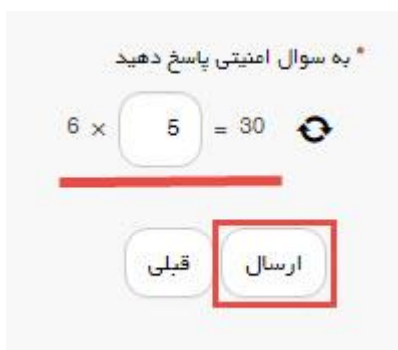
تصویر ۵- سوال امنیتی

سپس به سوال امنیتی پاسخ داده و بر روی دکمه ارسال کلیک کنید. (تصویر ۵)