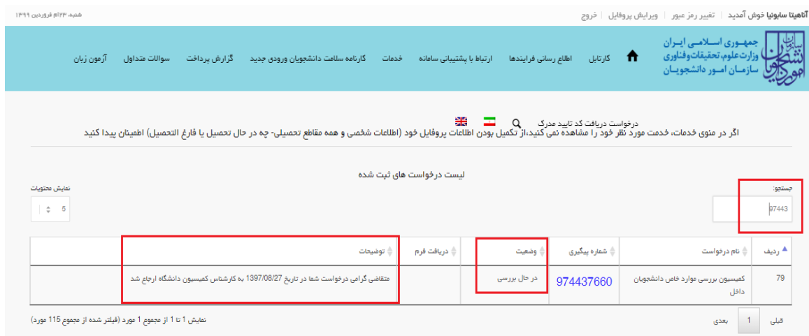
تصویر ۱۷- وضعیت ارجاع به کمیسیون

۶. در مرحله ای که کار در کارتابل کمیسیون دانشگاه قرار می گیرد پیغام زیر به متقاضی نمایش داده می شود. (تصویر ۱۷)